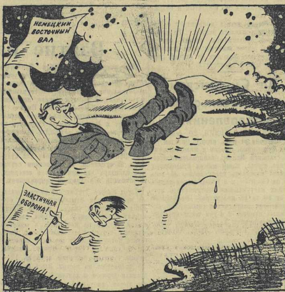
«Удивительная лужа... Она занимает почти всю площадь. Прекрасная лужа!» (Н. В. Гоголь «Миргород»).